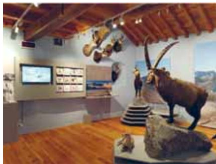
Museo Civico Alpino “A. Tazzetti” - Sala Vette

Museo di Usseglio: nel nuovo allestimento inaugurato l’anno scorso, sarà possibile vedere le recenti acquisizioni della sezione arte-storia e la mostra, Di rifugio in rifugio. Scenari di alpinismo nelle Valli di Lanzo . Inaugurazione: 9 luglio, ore 16,00. La mostra durerà fino al 28 agosto. Orario apertura museo: 10-12 | 15-18, chiuso il lunedì e il giovedì.