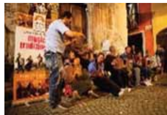
Suonatori della Val Varaita

SONO INVITATI BALLE- RINI E AMANTI DELLA LINGUA FRANCOPRO- VENZALE